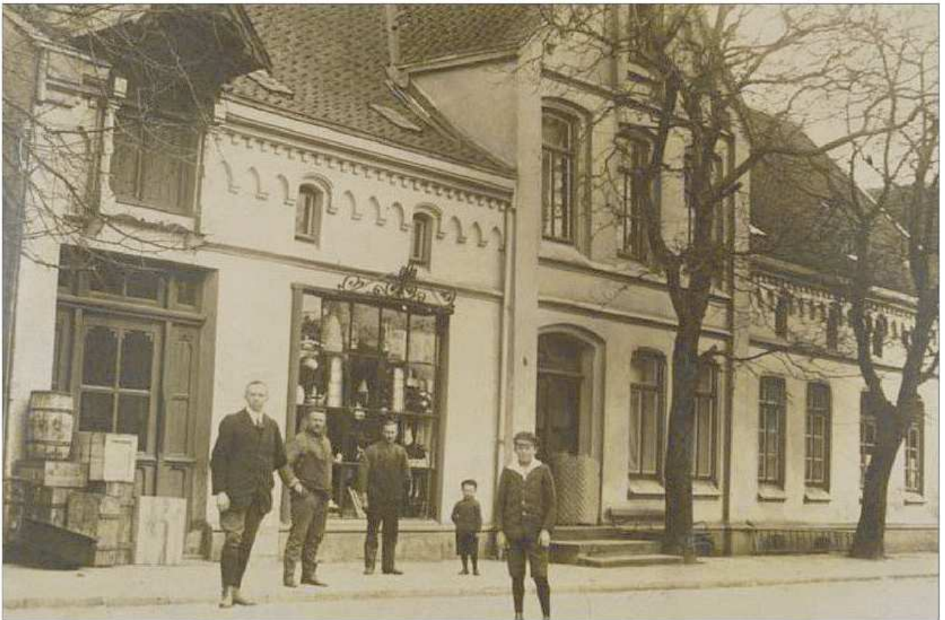
Ein Bild aus früheren Zeiten: So sah das Gebäude an der Brinkstraße mit der alten Schmiede und der Eisenwarenhandlung vor circa 100 Jahren aus.