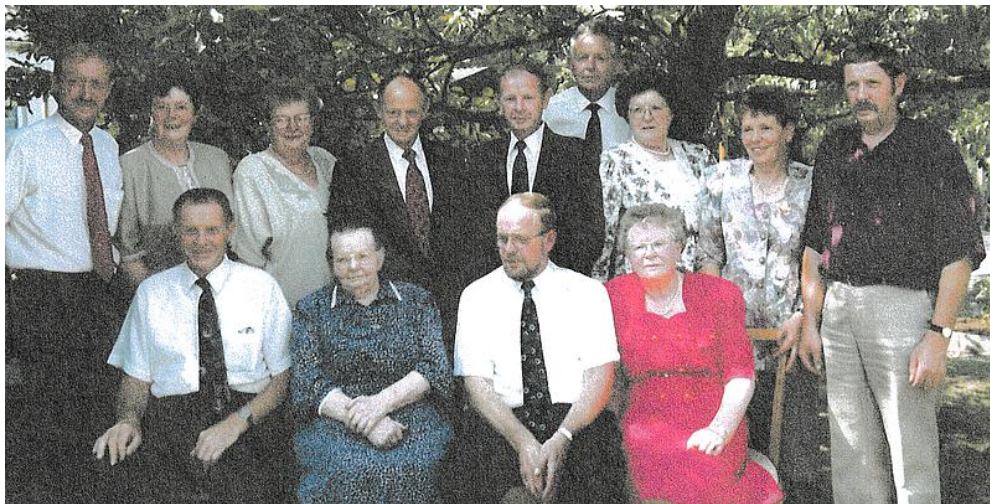
Familientreffen im Jahre ????