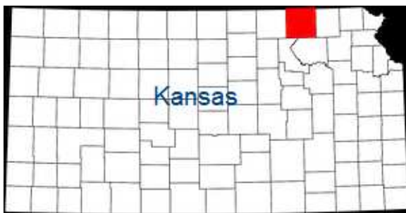
Marshall County in Kansas – Detail rechts