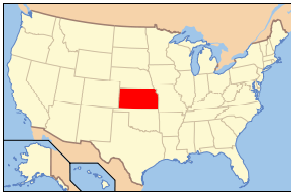
US Staat Kansas