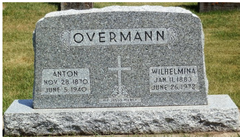
Saint Peter and Paul Cemetery, Petersburg, Delaware County, Iowa – by The Pealers *1