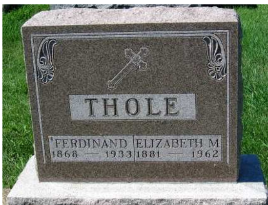
Saint Theresa Cemetery, La Motte, Jackson County, Iowa