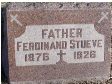
Mount Calvary Cemetery, Kansas City, Wyandotte County, Kansas *1