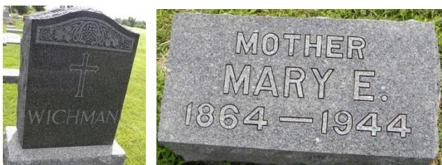
Saint Peter and Paul Cemetery, Nemaha County, Kansas *1 – by K-B