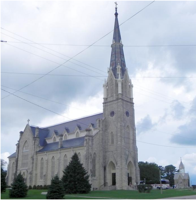
St. Bonifacius Kirche in New Vienna