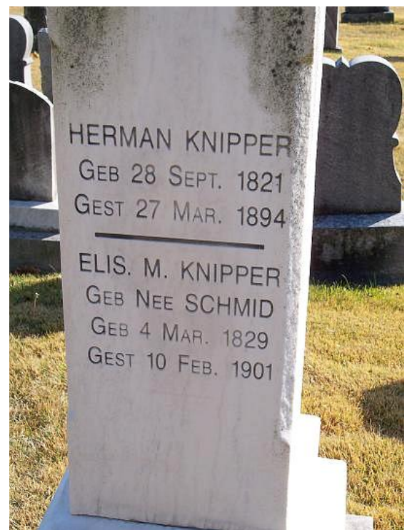
Saint John Cemetery, Covington, Kenton County, Kentucky *1