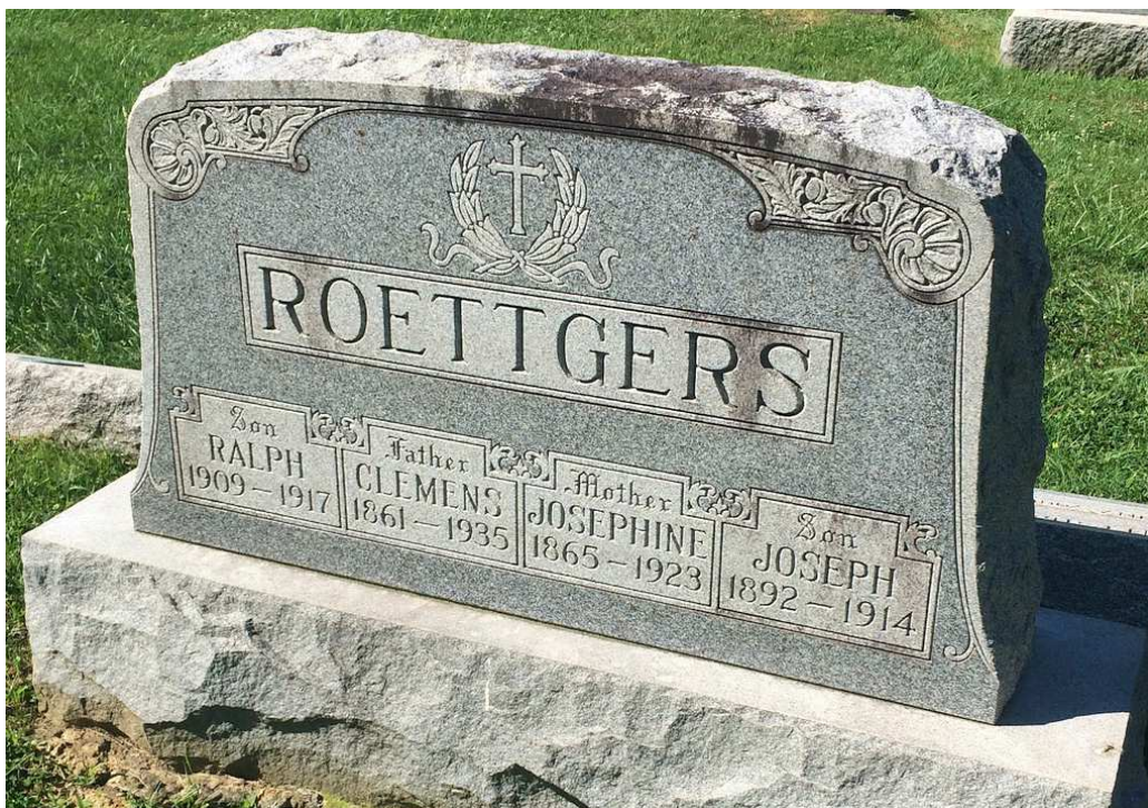
Friedhof: Mother Of God Cemetery, Kenton Vale, Kenton County, Kentucky, by: Todd Whitesides