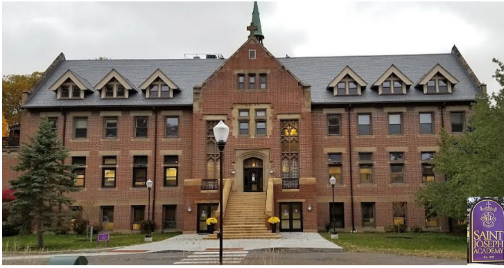
St. Joseph Academy in Cleveland, OH 3470 Rocky River Drive –gebaut 1898 - letzte Wirkungsstätte