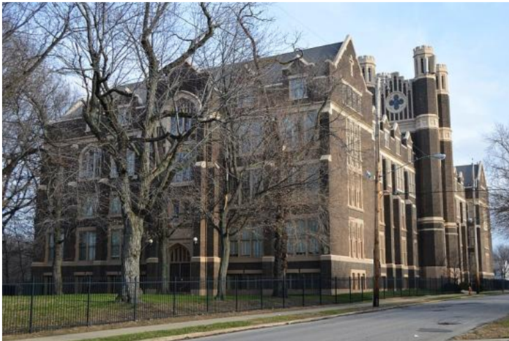
Notre Dame Academy in Cleveland, 1325 Ansel Road - gebaut 1914 - Mutterhaus/Provinzhaus