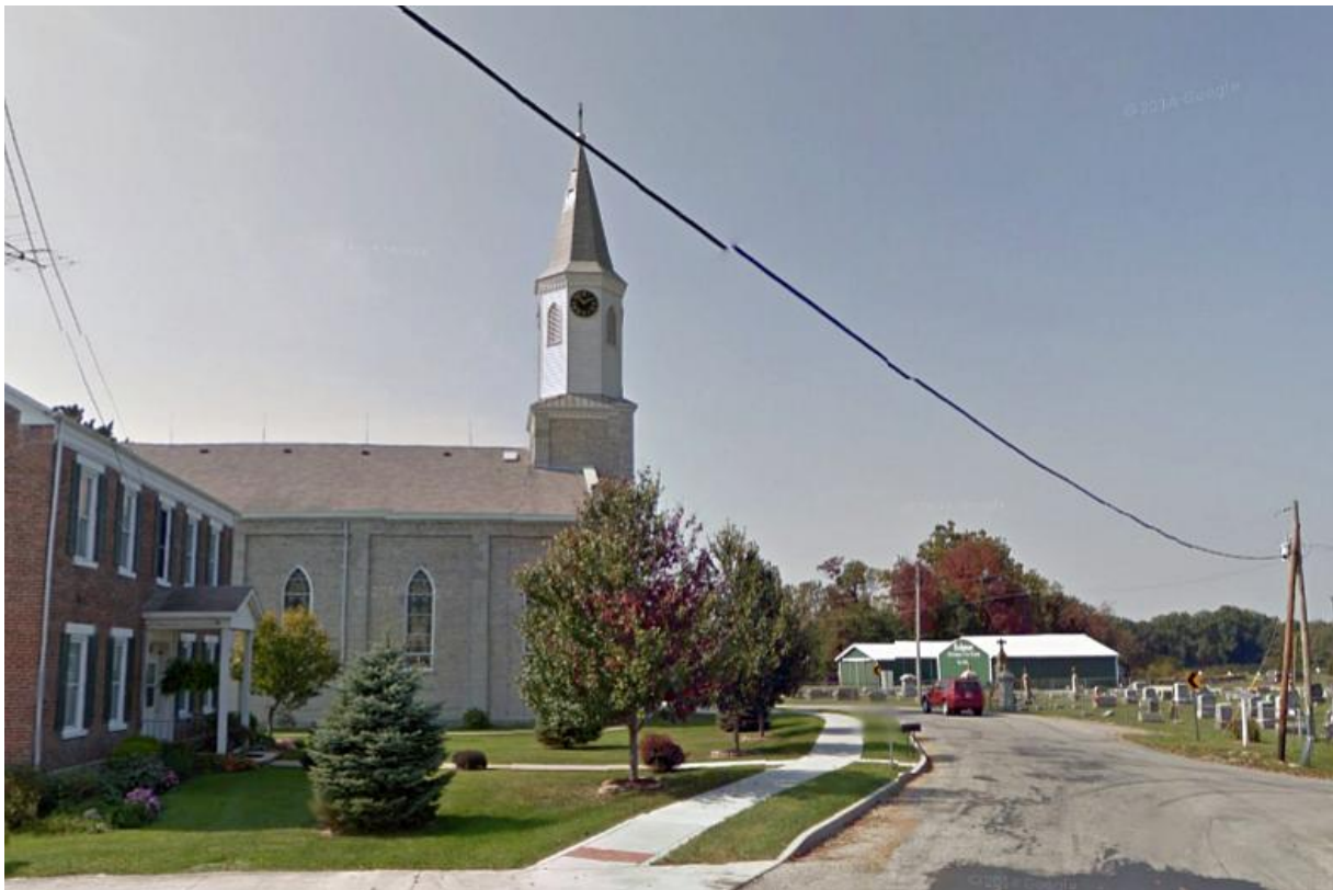
St. John Kirche und Friedhof - Salt Creek Township, Enochsburg, Decatur County, Indiana *1 / Google Map