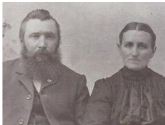
Franz Joseph Pille: Immaculate Conception Cemetery, Haverhill, Marshall, Iowa – by Bobbi, Genealogy Buff *1