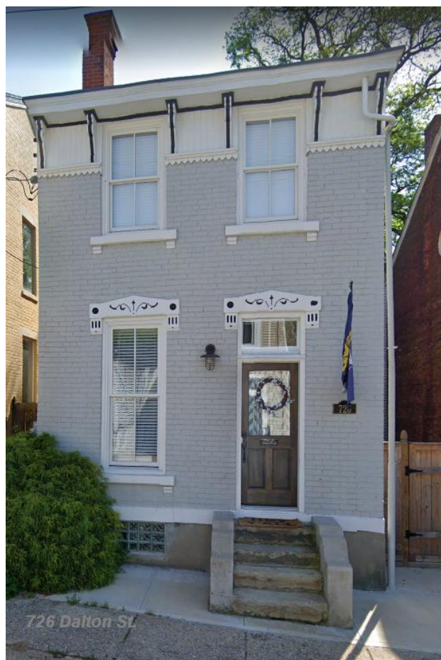
Ehemaliges Wohnhaus in Covington, Kentucky