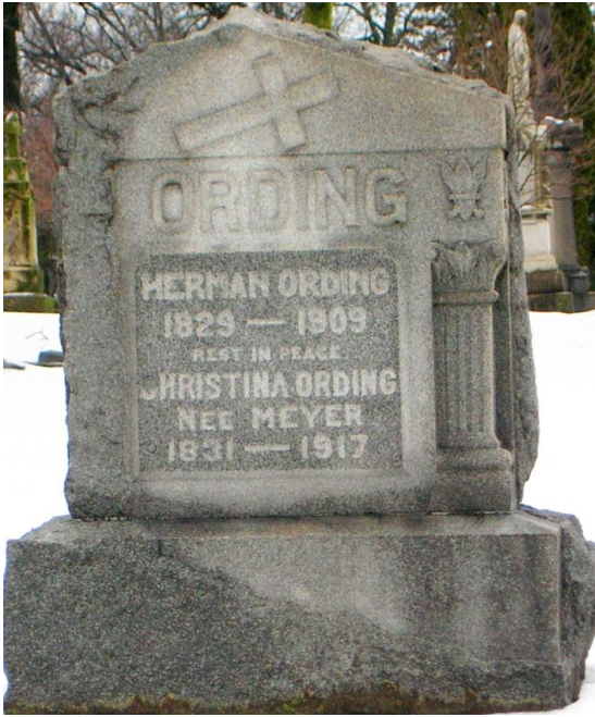
Calvary Cemetery, Evanston, Hamilton County, Ohio – by Vicki Now *1