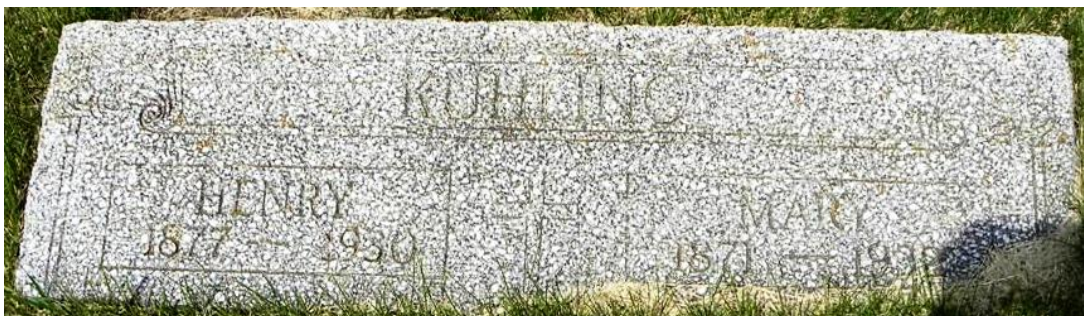
Saint Augustine, Catholic Cemetery, Capioma Township, Nemaha County, Kansas * 1