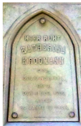
Saint Augustine Cemetery, Halbur, Carroll, Iowa *1 – by skanne