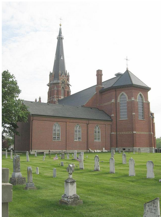
J.H.F. Klone - Friedhof Saint Michael Cemetery, Fort Loramie, Shelby County, Ohio *1

Quellen: Die wesentlichen Daten wurden ermittelt von Father David Hoying, Minster