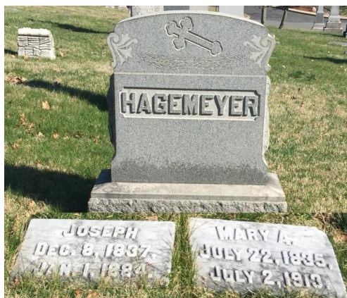
St. Mary Cemetery, Saint Bernard, Hamilton, Ohio *5