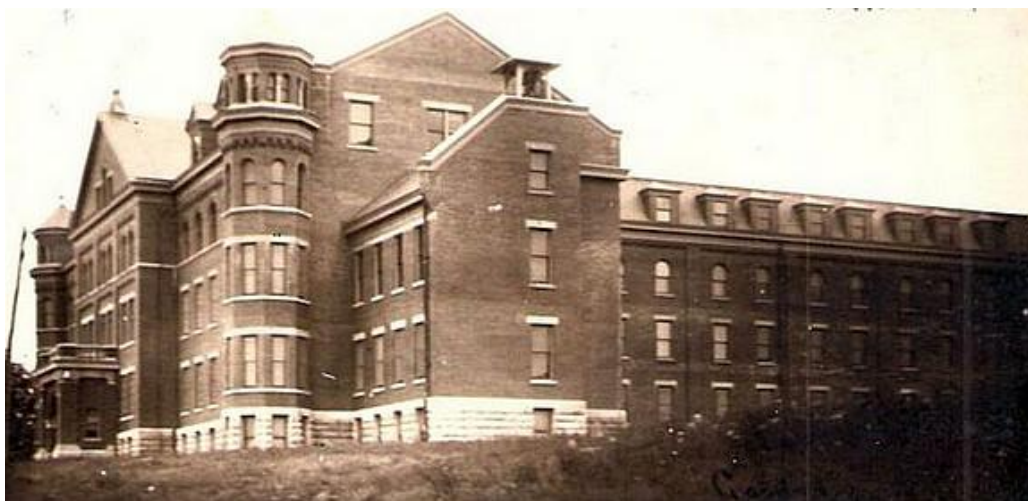
School Sisters of Notre Dame (SSND), Mankato, Minnesota, 1909