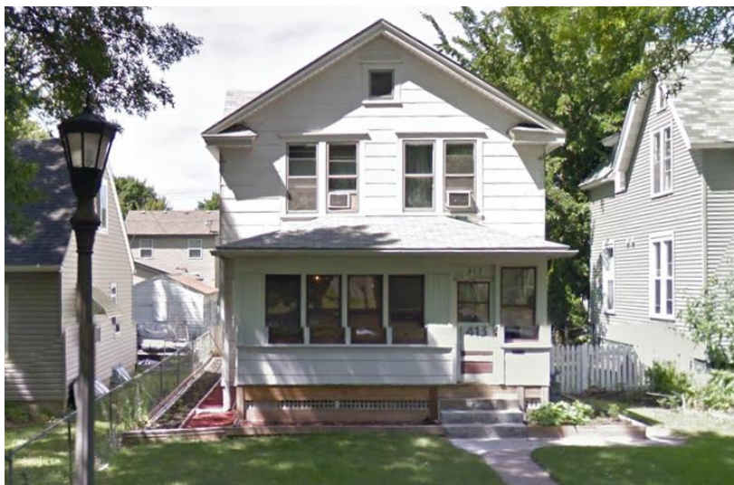
Wohnhaus um 1900 *2e - 413 Lafond Ave, Saint Paul, Minnesota - Aufgenommen 2016 - © 2022 Google -