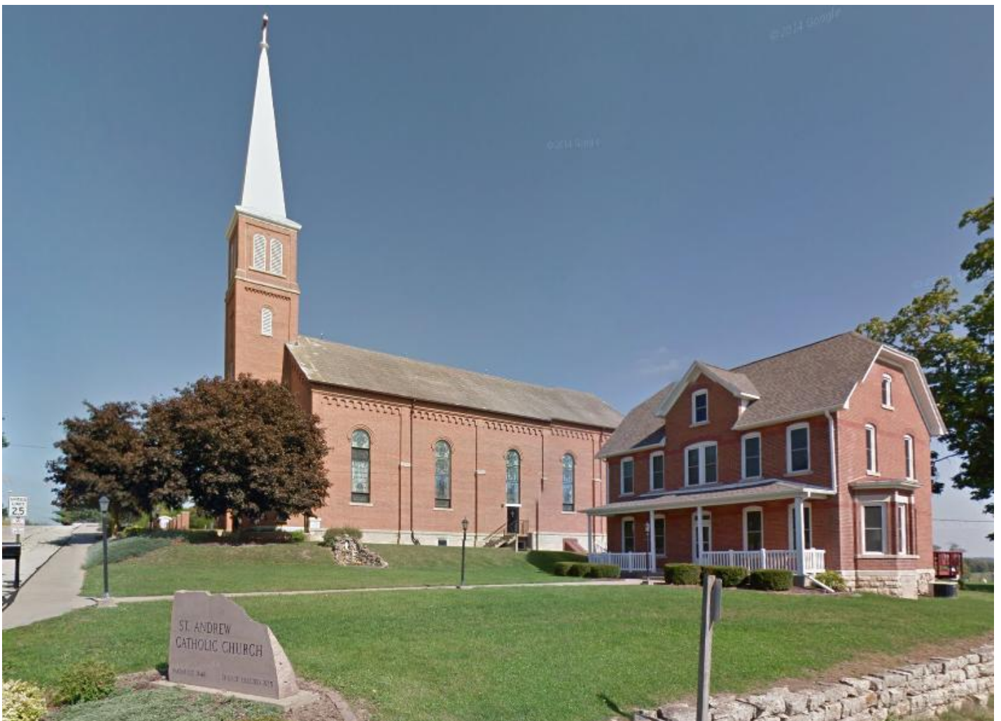
St. Andrew catholic church mit Pfarrhaus (früher Konfessionsschule / Kloster) in Potosi/Tennyson, Wisconsin