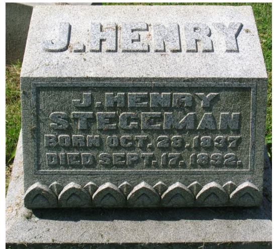
rechts: Evergreen Cemetery Southgate, Campbell County, Kentucky, USA