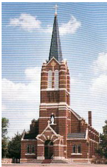
Kirche in Windthorst